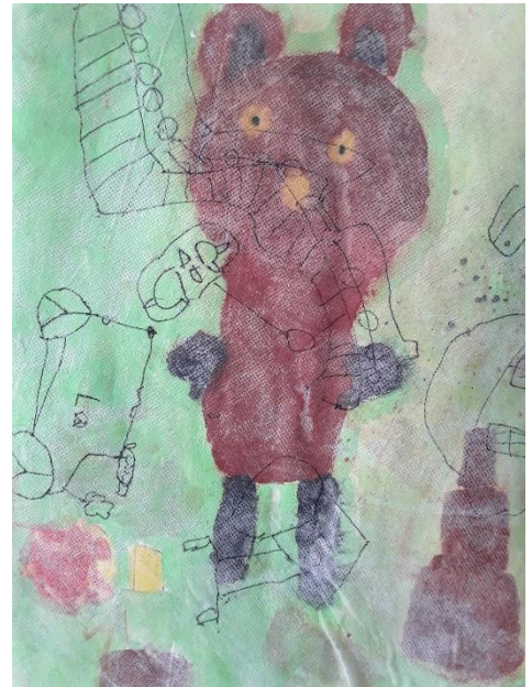
Žan Lapajne, 1. g

Predmet bo potekal 2 uri/14 dni. Namenjen je učencem 4. in 5. razreda PŠ Godovič.